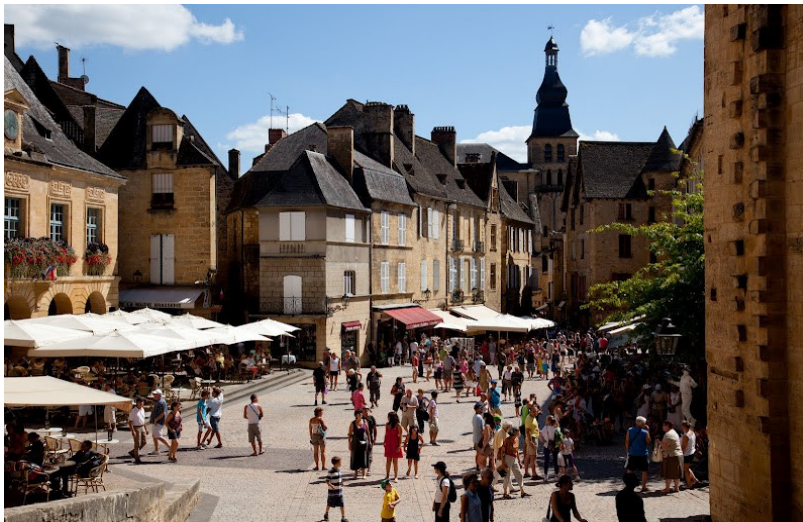
Place de la Liberté met links het stadhuis en rechts vooraan de overdekte marktplaats.

Er is een drukbezocht gedeelte met terrasjes, kraampjes en straatartiesten, zoals de Place du Peyrou voor de Cathédrale en de Place de la Liberté voor het stadhuis. In de relatief koele en rustige omliggende straatjes en steegjes lijkt de tijd te hebben stilgestaan omdat alleen bestemmingsverkeer de stadspoorten binnenkomt. Sarlat blijft om iedere hoek verrassen... zeker als je niet vergeet omhoog te kijken!